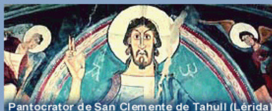
Pantocrator de San Clemente de Tahull (Lérida)